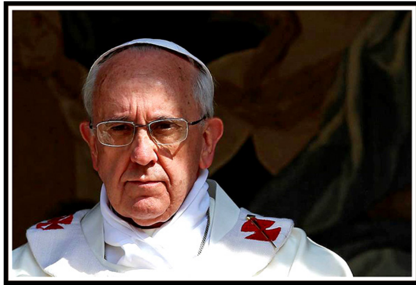
Een wolf in schaapskleren?

De schapen luisteren naar hun herder; laten zich niet van de wijs brengen en verkiezen het moeizaam bestaan. De wolf in schaapskleren is het beeld van de voorzegde Valse Profeet, van de samenheuler met de Antichrist. Het hier gebruikte woord voor beest is 'therion', wat eigenlijk wild beest of woesteling wil zeggen. Zo komt het 36 maal (6x6) voor als beeld voor de Antichrist. (4) De Valse Profeet ziet eruit als een schaap, loopt als een schaap en spreekt als een schaap. Ook hij wordt eenmaal 'therion' genoemd. Ondanks dat deze indringer er schaapachtig uitziet, zullen Christus' volgelingen hem aan zijn stem herkennen.