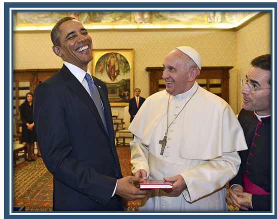
Bergoglio ontmoet US President Obama op 27 juni 2014

Bergoglio is duidelijk iemand die andere godsdiensten en denominaties omarmt. Alles wijst erop dat hij ze in één superkerk wil onderbrengen, een ontwikkeling waar reeds Paus Pius X (†1914) zijn stem tegen verhief. Bergoglio is niet vies van verregaande interreligieuze dialoog. In zijn functie neemt hij vaak deel aan interreligieuze bijeenkomsten. Zijn opstelling bleek ook uit zijn buitengewoon felle reactie op de zogenaamde regensburgtoespraak van Paus Benedictus. Op 12 september 2006 klaagde deze paus het heersende relativisme in de Westerse cultuur aan en citeerde daarbij een uitspraak van de Islamitische geleerde Ibn Hazm (†1064), die stelde dat als God het wil we zelfs afgodendienst zouden moeten bedrijven, waarmee Hazm wilde aangeven dat in het opvolgen van Gods wetten geen plaats is voor redelijk denken; louter het gebod volstaat. En nog steeds is een dogmatische afkeer van het redelijk denken een typisch kenmerk van de Islam! (11) Bergoglio reageerde vanaf zijn bisschopszetel in Argentinië, wat in de Spaanse uitgave van Newsweek kwam: “Ik identificeer mij niet met de woorden van de Paus. Indien een paus de Islamitische waarden niet erkent verstoort hij in twintig seconden wat in de voorbije twintig jaar is opgebouwd.”