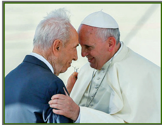
De Israëlische politicus Shimon Peres en Bergoglio ontmoeten elkaar op 4 sept. 2014

De paus hield op 8 juni 2014 een gebedsbijeenkomst voor de vrede, samen met de president van Israël, Shimon Peres, en Mahmoud Abbas, die hij de president van Palestina noemde (de correcte term is ‘president van de Palestijnse Autoriteit’). Voor het eerst in de geschiedenis werden koranverzen gezongen in het Vaticaan, en dit op persoonlijke uitnodiging van Bergoglio. De Islamitische voorganger besloot zijn gebed met de woorden: “Moge Allah ons leiden naar de overwinning op de ongelovigen!” (13)