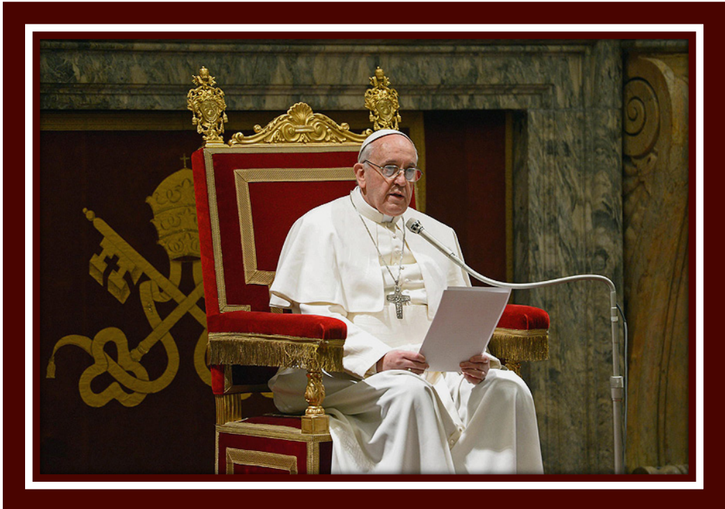
Maart 2013, tijdens het bezoek van paus Franciscus aan Syrië.